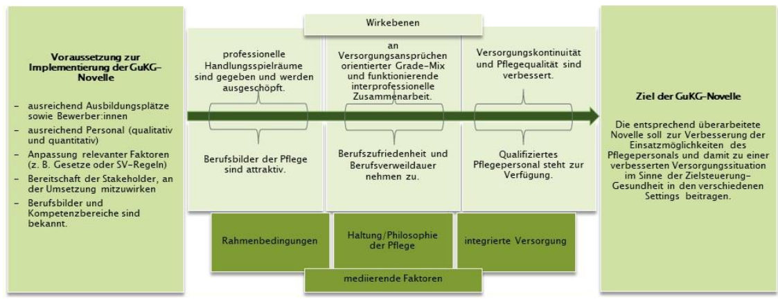
Abbildung 2: Change-Model